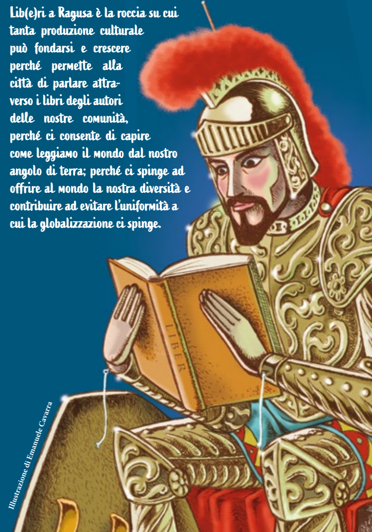
Illustrazione di Emanuele Cavarra